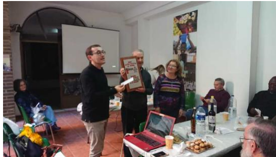
Foto de la celebración del XX Aniversario de SOLMUN